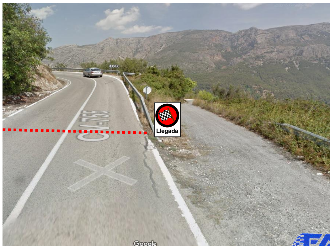
Imagen de la nueva Llegada.